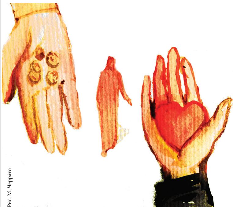
Рис. М. Черрато

Газета издается ежемесячно при поддержке «Renovabis» и добровольных пожертвований верующих. Распространяется бесплатно. Средний расход на один номер – 100 тенге. Банковский счет: «Казкоммерцбанк» 1101-5U5267-000, KZ 3292611015U5267000